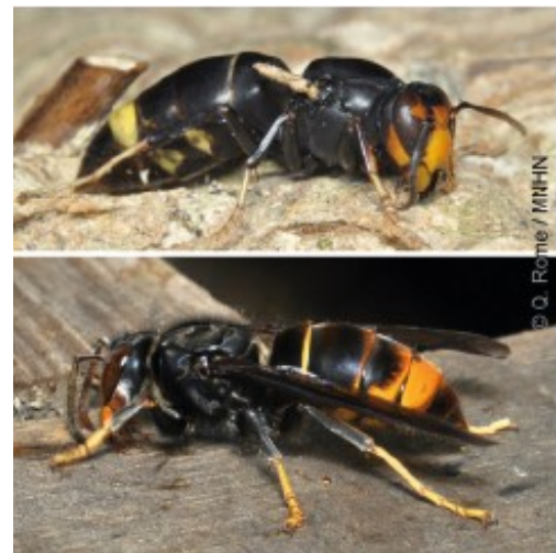
Rome, Q., Villemant, C. Le Frelon asiatique Vespa Velutina - Inventaire national du Patrimoine naturel. In: Muséum national d'Histoire naturelle- http://frelonasiatique.mnhn.fr

Au printemps, la reine est beaucoup plus grande que les ouvrières car ces dernières se sont développées dans de petites alvéoles du nid primaire.